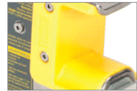
(A) Rúd csúszóelem